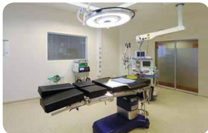
Salle de bloc opératoire.

Un pôle de consultations médicales & chirurgicales , situé au rez-de-chaussée de la Clinique, complète cette offre de soins :