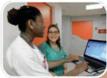
Le Service de Médecine interne

L'unité de Médecine se situe au 2 e étage (chambres 201 à 235). Elle est constituée de 30 lits, répartis en chambres particulières, chambres doubles et chambres «accompagnant».